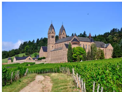
Kloster Abtei St. Hildegard