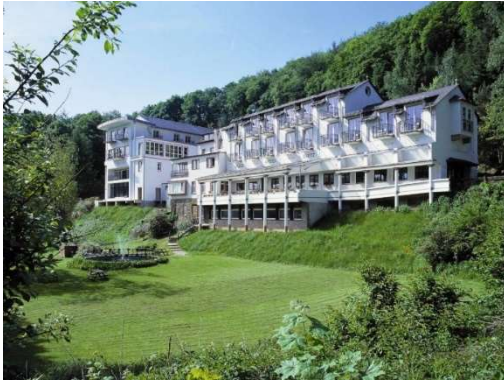
Hotellansicht aus dem Tal

und verfügt über einen Wellness Bereich, der euch nach den Touren angenehm entspannen und auflockern wird.