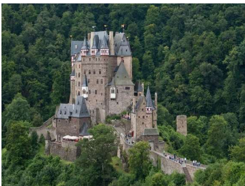
Die Burg Elz

Es gibt auch einige interessante Kulturdenkmäler in dieser Region, die es sich lohnt anzusehen. Wir könnten uns zB. die Burg Elz oder das Benediktiner Kloster, in dem Hildegard von Bingen lebte, anschauen oder das Niederwalddenkmal in den Weinbergen über Rüdesheim oder den Binger Mäuseturm, mitten im Rhein oder die berühmte Loreley.